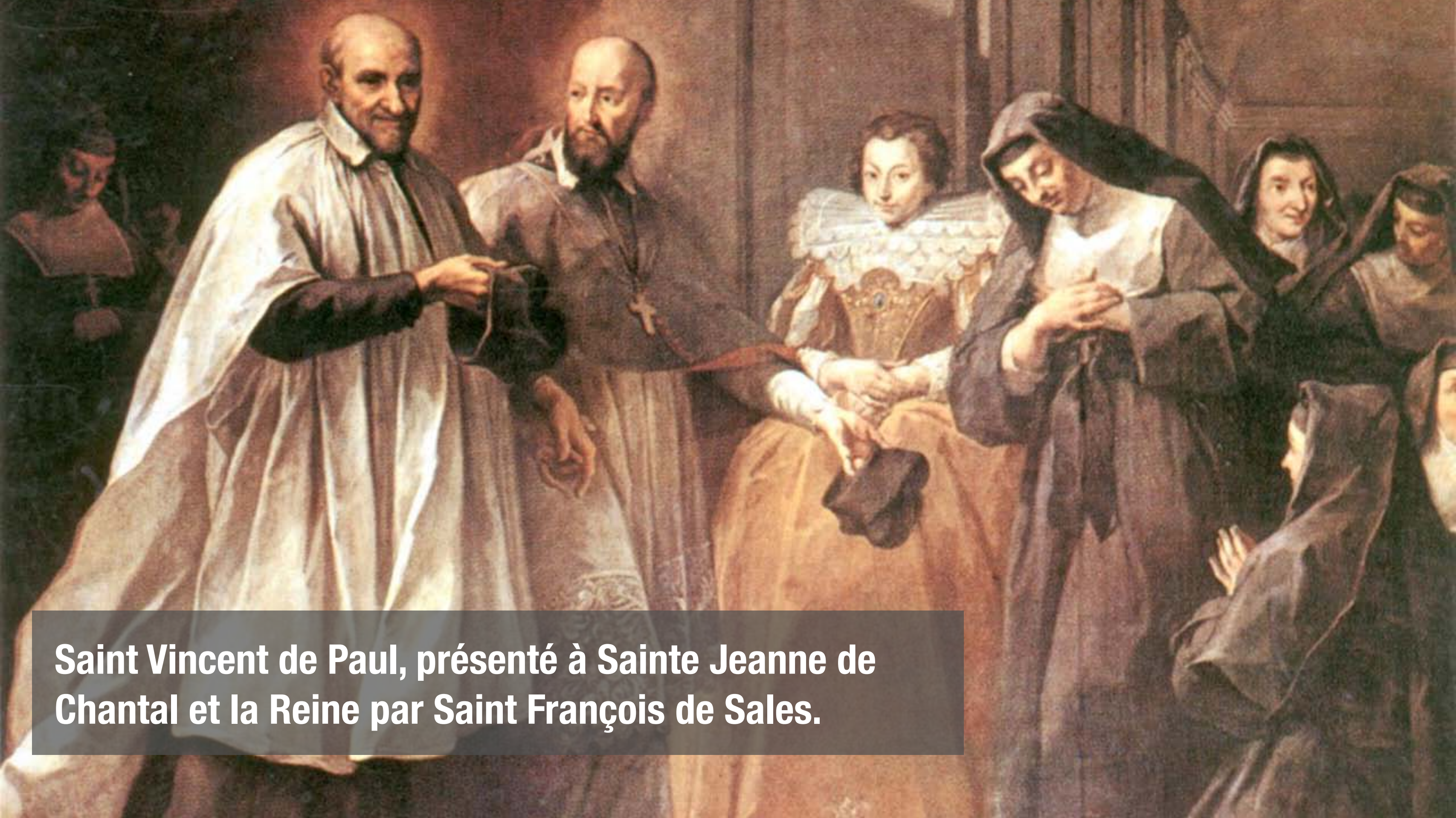
Saint Vincent de Paul, présenté à Sainte Jeanne de Chantal et la Reine par Saint François de Sales.