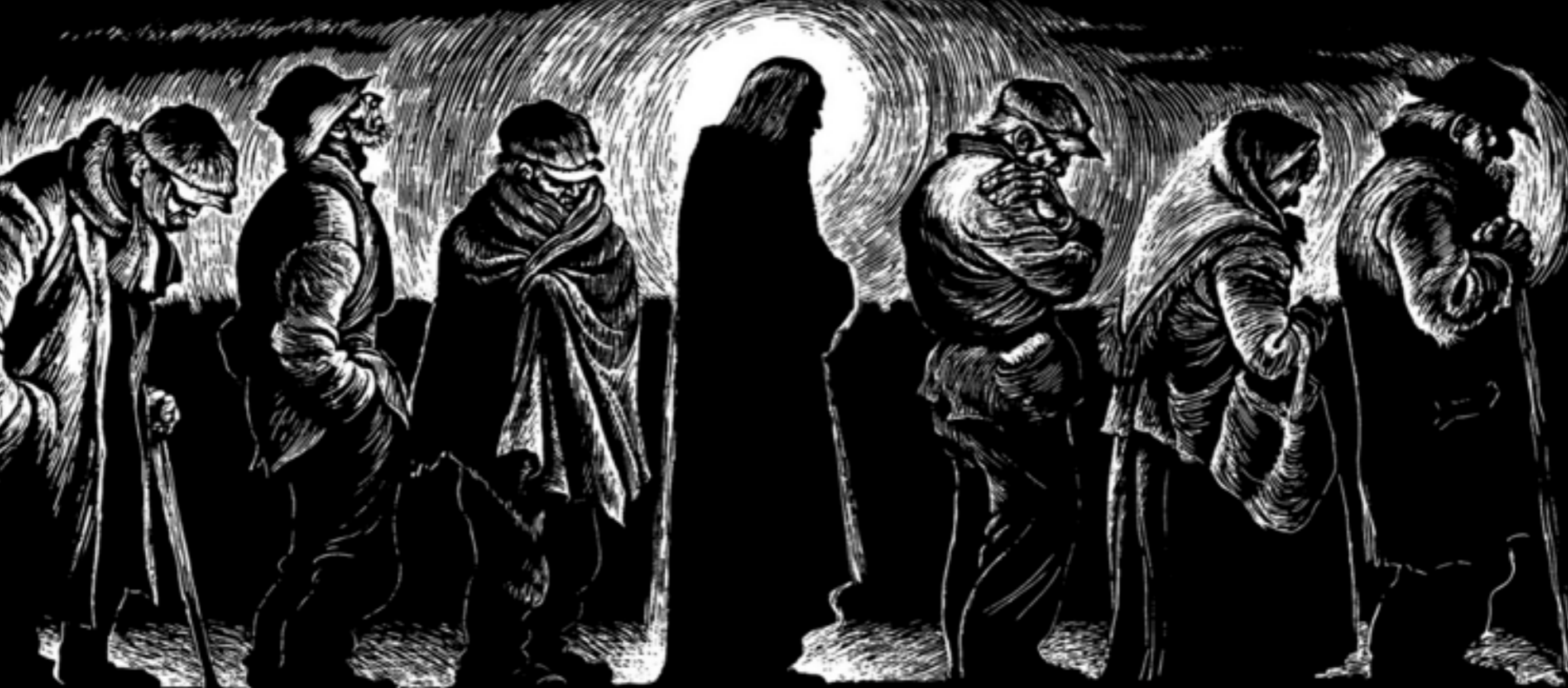
«Christ of the Breadline» (Le Christ de la queue pour la soupe populaire) par Fritz Eichenberg. EICHENBERG

Du fait de son Incarnation, on peut trouver Jésus aujourd'hui dans toutes ces longues files d'attente que l'on retrouve dans d'innombrables villes à travers le monde, longues files d'hommes et de femmes qui crient à chaque heure du jour, demandant à être reconnus comme des membres à part entière de la société.